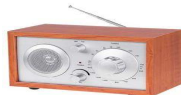
Ascultați posturile locale de radio pentru eventuale instrucțiuni și recomandări