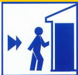
Intrați într-o clădire