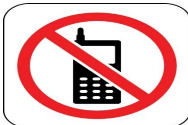
Nu telefonați ! lăsați liniile libere pentru forțele de intervenție