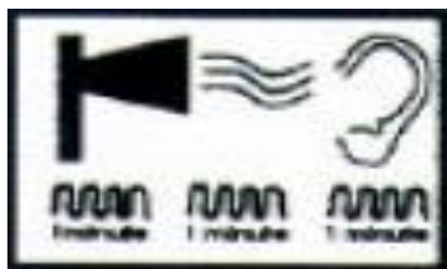
Așteptați instrucțiunile autorităților sau semnalul de încetare a alarmei pentru a ieși