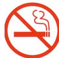
Utilizarea flăcării și fumatul sunt interzise