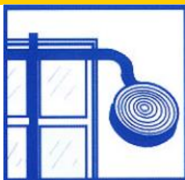
Etanșați toate intrările de aer